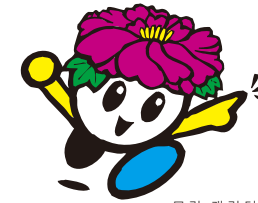
모란 캐릭터 「드림피오리」

4월 하순에서 5월 초순이 되면 다이콘시마 섬이 형형색색의 모란꽃으로 가득 차는 이벤트가 개최됩니다. 나카우미 지역 향토 예술과 무대 행사 및 특산물 판매장이 열리기 때문에 많은 관광객이 방문하는 시기입니다.