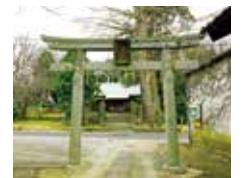
지진 신사 (후타고)