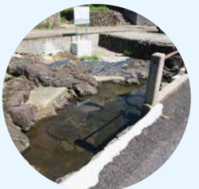
하뉴의 용수 다이콘시마 섬은 약수를 중심으로 취락이 형성되어 있으며, 섬에서는 이를 '가와'라고 부르며 생활용수로 이용되어 왔습니다. 지금도 샘솟고 있는 용수 중 하나가 하뉴 지구의 '하뉴의 용수'이며, 시마네 좋은 물 100선에도 선정되었습니다.