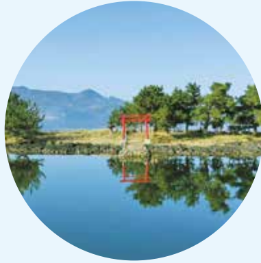
교지마 뉴코의 앞바다에 떠 있는 섬. '나카우미 호수'의 요메가시마라는 애칭으로 불리며, 물새 떼와 정승이 하나가 되어 보는 이의 마음을 달래줍니다.