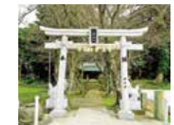
산쇼 신사 (뉴코)