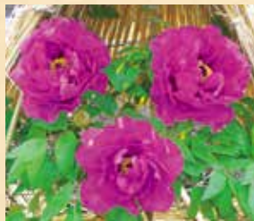
상표 등록: 겨울 모란

시마네현에 들어오면 바로 있는 패밀리마트입니다. 여기에만 있는 다이콘시마 섬 에시마대교의 기념품이 많이 준비되어 있습니다. 내려서 베타후미자카를 걸으실 분들은 패밀리마트 주차장을 이용해 주세요. 【주소】 아쓰카초 에시마 1128-110 【전화】 0852-76-9250 【영업시간】 24시간 (연중무휴)