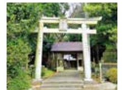
산사 신사 (오소에)

이즈모국풍토기에도 기재되어 있는 신사라고 한다. 원래는 다이콘시마 섬에 있었으나, 목장을 만들기로 하면서 에시마 섬으로 이주를 명령받은 다이콘시마 섬의 주민들과 함께 신사도 이전된 것으로 추정된다. 경내에 있는 섬돌로 만든 등불이 볼거리.