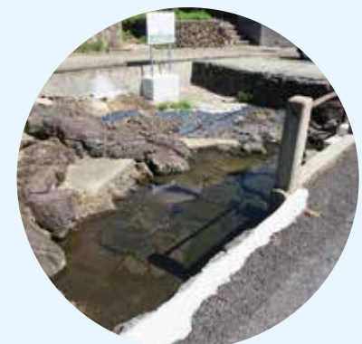
하뉴의 웅수 다이콘시마 섬은 약수를 중심으로 뒤희이 형성되어 있으며, 섬에서는 이를 '가와'라고 부르며 생활용수로 이용되어 왔습니다. 지금도 샘내고 있는 웅수 중 하나가 하뉴 지구의 '하뉴의 웅수'이며, 시마에 흘린 물 100선에도 선정되었습니다.