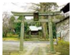
지진 신사 (후타고)