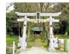
산쇼 신사 (뉴코)