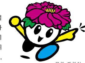
모란 캐릭터 「드림피오니」

4월 하순에서 5월 초순이 되면 다이콘시마 섬이 형형색색의 모란꽃으로 가득 차는 이벤트가 개최됩니다. 모란의 절화 품평회, 모란을 전시한 '모란 갤러리', 모란 밭을 둘러보는 '모란 위크'가 열리며, 모란을 한껏 즐기실 수 있습니다. 또한 나카우미 지역 향토 예술과 무대 행사 및 특산물 판매장이 열리기 때문에 많은 관광객들이 모여듭니다.