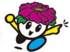
牡丹キャラクター「ドリームピコニ」

大根島が牡丹の花で彩られる4月下旬~5月初旬に開催されるイベント。牡丹の切花品評会、牡丹を展示した「牡丹ギャラリー」、牡丹畑などをめぐる「牡丹ウォーク」が行われ、牡丹を堪能できます。また、中海圏域の郷土芸能などのステージイベントや特産屋台村が催され、多くの観光客で賑わいます。