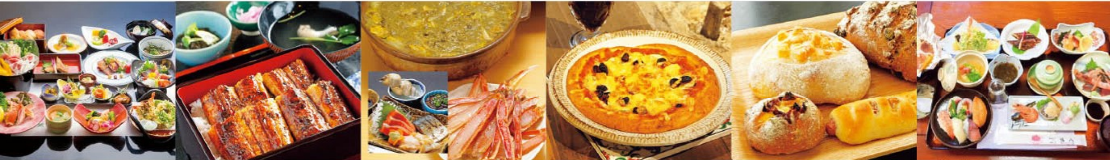
11.「会席料理」 旬の味をお届けします。 10.「うなぎ」 さばきたて、焼きたての鰻にこだわったうなぎは絶品。 9.「活松葉がに鍋」 濃厚なかに味噌と白菜の甘みがたっぷり入ったスープに、活松葉がにが入った贅沢なお鍋です。 8.「石窯ピザ」 本格的な石窯で焼いたピザはもちもち、サクサク! 7.「パン各種」 ふんわり、もちり、サクサクのパンが勢揃い。 6.「会席料理」 新鮮な食材が盛りだくさん。