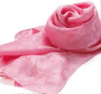
大根島染物工房 【所在地】八束町寺津139 【電話】0852-76-2851(津部) 【予約】7日前までに

平成3年、八束町の30名の有志による「牡丹染研究会」として活動がスタート。京都へ染物研修など独自の勉強会を開催し、「素材」と「染料」を発見、牡丹の染物として商品開発されました。平成20年に名称を「大根島染物工房」と変更し、牡丹染めの販売を行い、商標登録も取得しています。牡丹が開花を始めて一番良い状態の花びらを摘み取り、原料として自然のまま染め上げたものです。