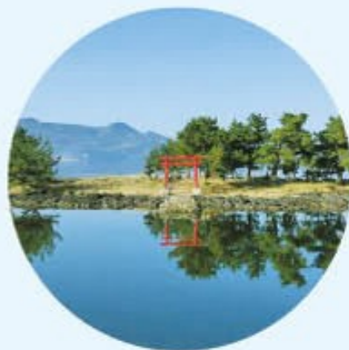
京島 入江の沖合に浮かぶ島。「中海の線ヶ島」の愛称で呼ばれ、水鳥の群れと青松が一体となって見る人の心を癒します。