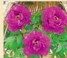
商標登録：冬ばたん

服と雑貨 こんぺいとう さり気なく心地よい服と生活のアクセントを愉しむ雑貨。自然の風景に馴染む生活スタイルをご提案します。 【所在地】八束町波入1748-1 【電話】0852-76-3361 【営業】10:00~17:00(木曜定休)