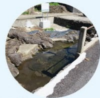
波入の湧水 大根島では、湧水を中心に集落が形成されており、島ではこれを「かわ」と呼び、生活用水として利用されてきました。今なお、湧いている湧水の一つが波入地区の「波入の湧水」で、島根名水百選に選ばれています。